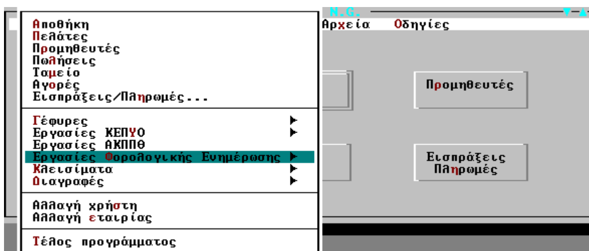
Σχ. 6, Εργασίες Φορολογικής Ενημέρωσης

Στο μενού των Εργασιών της εφαρμογής, προστέθηκε το νέο μενού " Εργασίες Φορολογικής ενημέρωσης ", στο οποίο εμπεριέχονται οι παρακάτω διεργασίες που είναι απαραίτητες για τη συλλογή και αποστολή των φορολογικών στοιχείων: